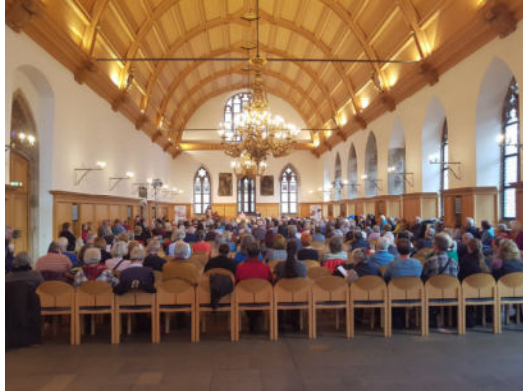
Oben: Vorvorgevortrag im historischen Rathaussaal Rechts: Vorstellung unserer YouTube-Filme Gesetzliche Betreuung Nürnberg - YouTube